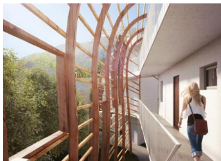
Zu den Entwurfsgedanken zählten unter anderem die Harpe zum Heutrocknen.

Visualisierungen: Ralph Mousel – umfeld concept