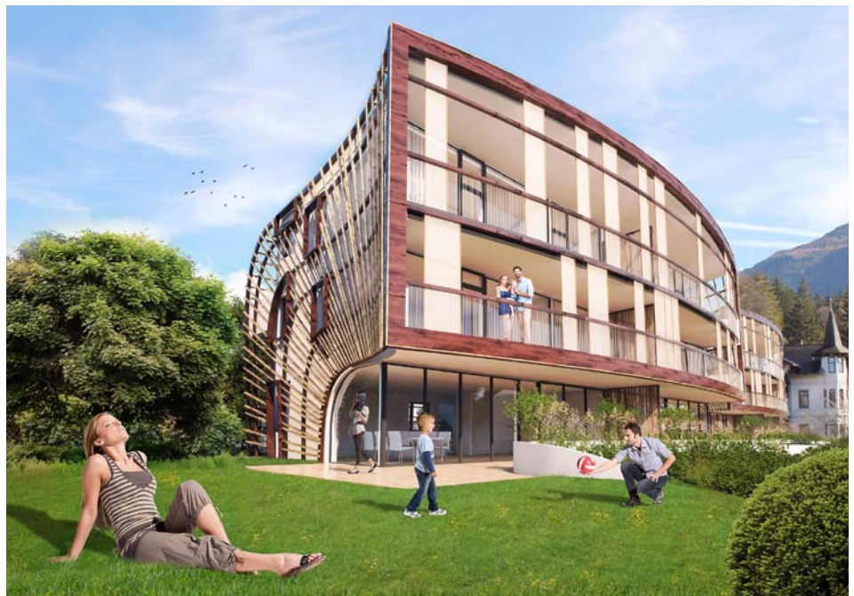
Die markante Gebäudeform wird durch die Holzlattung verstärkt, welche das Gebäude nach außen hin abgrenzt und gleichzeitig die Offenheit und Transparenz eines modernen Lebensraums ermöglicht.

Als Makler ist „saphir – umfeld.real estate“ exklusiv mit der Vermarktung des Projekts LUX betraut. In deren Geschäftslokal in der Adamgasse 11 gab es 2014 auch eine kleine Ausstellung zum Projekt das die architektonischen Entwurfsgedanken erläutert. Der Spatenstich erfolgte im Sommer 2014 und die Hälfte der Wohnungen ist bereits verkauft. Die Übergabe an die Eigentümer erfolgt im Frühjahr 2016.