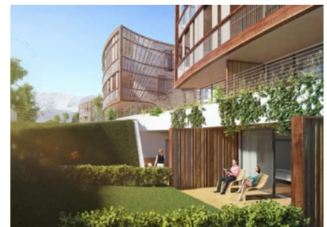
Sonnige Gärten und Terrassen: viel Grün, viel Sonne und viel Ruhe – perfekt zum Entspannen!